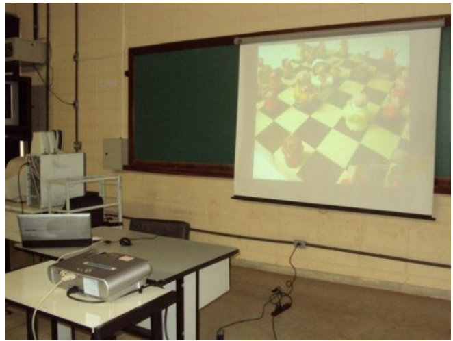
Figura 2 – Imagem projetada em sala de aula.

- para o pré-teste, cada participante teve 20 minutos para preencher, individualmente, a Escala de Diferencial Semântico (ver tabela 1), selecionando em cada uma das duplas de conceitos bipolares das Técnicas Visuais o grau, em uma escala codificada de +3 a -3, que melhor representava sua percepção estética e cultural a respeito da imagem projetada, objeto de análise.