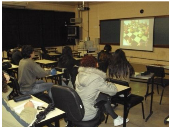
Figura 3 – Pré-teste: Percepção Estética Individual.

- para o pré-teste, cada participante teve 20 minutos para preencher, individualmente, a Escala de Diferencial Semântico (ver tabela 1), selecionando em cada uma das duplas de conceitos bipolares das Técnicas Visuais o grau, em uma escala codificada de +3 a -3, que melhor representava sua percepção estética e cultural a respeito da imagem projetada, objeto de análise.