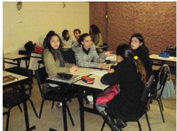
Figura 4 - Pós-teste: Percepção Estética Coletiva.

A tabela 2 indica o número de respondentes para cada grau da Escala e foi dada ênfase (grifado em tons de vermelho) ao grau que a maioria dos respondentes assinalou, considerando também as outras respostas individuais na somatória dos pontos. Esta tabela é o resultado do pré-teste, sendo denominada de “Percepção Estética Individual”.