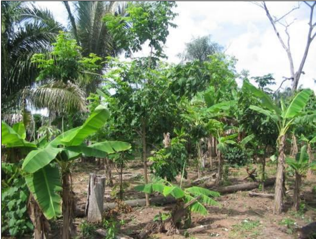
Figura 2 - Aspecto de um SAF – Boqueirão – Vila Bela/MT (Fonte: Projeto Guygrofor, 2006).

Entre os principais resultados alcançados consta uma gama de informações, entre as quais podemos citar: de que modo os grupos das localidades selecionadas para pesquisa se relacionam entre si com a sociedade envolvente, com o ambiente; quais suas estratégias de sobrevivência, que tecnologias conservam ou incorporam a partir das relações com o entorno; quais os limites e possibilidades dessas estratégias perante a nova situação por que passam esses grupos ao se relacionarem com novos conhecimentos e tecnologias oriundas do mundo urbano-industrial; quais as chances de sobrevivência ou continuidade de sua reprodução social em um mundo, agora globalizado, onde tudo vira mercadoria, inclusive seus saberes ou conhecimentos, até então ignorados pelos centros hegemônicos 8 .