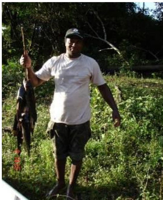
Figura 3 - Pesca – Quilombola de Boqueirão, Vila Bela (Fonte: Projeto Guyagrofor, 2006).

Os recursos ou objetos manipulados no ou pelo mundo urbano-industrial estiveram presentes ali desde a chegada de africanos e de portugueses à região na década de 1730. Mas a relação com o mundo urbano-industrial sempre foi muito tênue, sobretudo no século XIX e grande parte do século XX, período em que na região permaneceram quase que tão somente sociedades negras e indígenas (cf. Bandeira, 1988; Leite, 1993; Casto & Galetti, 1994). Por isso utilizavam, até tempos muito recentes, técnicas ou tecnologias que estamos aqui denominando – na falta de um termo mais adequado – precárias . Essa concepção implica a utilização de recursos materiais que se apresentam próximos ao usuário, favorecendo a elaboração de objetos de uso imediato e que respondam às necessidades existenciais do sujeito e de seu grupo, configurando, portanto, a aplicação de atos criativos que não podem ser imediatamente submetidos a julgamentos comparativos e, ou, hierarquizações. Tal tecnologia foi viabilizada quando os descendentes de escravos de Vila Bela lançaram mãos dos recursos naturais disponíveis (elementos zoobotânicos, do solo e do subsolo) e aparatos urbano-industriais (machado, facão) para manejar os recursos citados. Para isso aproveitaram tanto a experiência do português quanto a do indígena, com os quais estabeleceu relações (seja de amor, seja de ódio) desde o século XVIII (cf. Leite, Silva & Mendes, 2010). Deste último parece que aprenderam a técnica da pesca com arco e flecha, conforme segue.