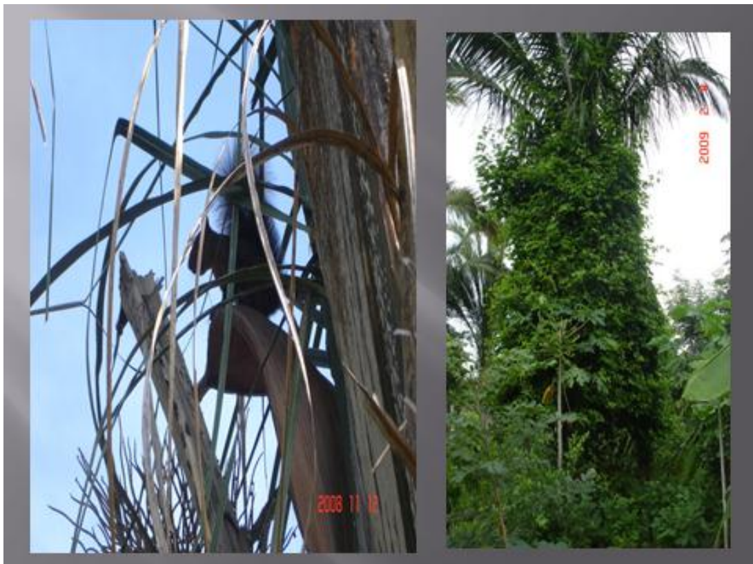
Figura 7 - Palmeira com caxinguelê e servindo de suporte para a expansão da rama do maracujá.