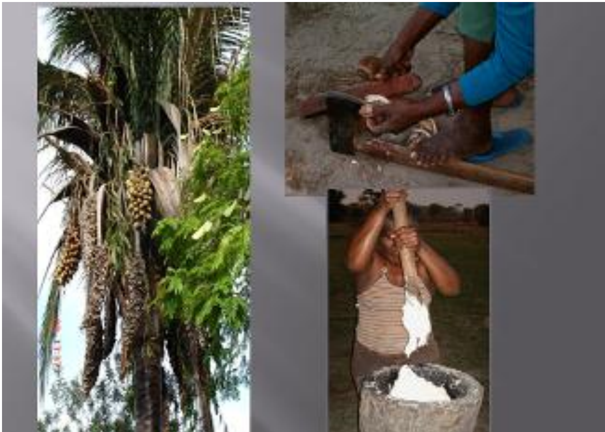
Figura 4 - Manipulação do babaçu com o uso de machado e facão.

Veja que para essa manipulação consta tanto uma “tecnologia precária”, quanto um machado de aço. Este, apesar de ser um produto tipicamente urbano-industrial, vai tornando-se também uma tecnologia precária (ou seria obsoleta?), dada a presença marcante da motosserra na localidade de Boqueirão, assim como de outros instrumentos técnicos “modernos” destinados a manipular os elementos naturais. Tais instrumentos agora são movidos com o concurso de hidrocarbonetos, por meio de motores a diesel ou gasolina, que movimentam tratores, retroescavadeiras e motosserras, ou de energia elétrica, que movimenta furadeiras, trituradores, liquidificadores e batedeiras.