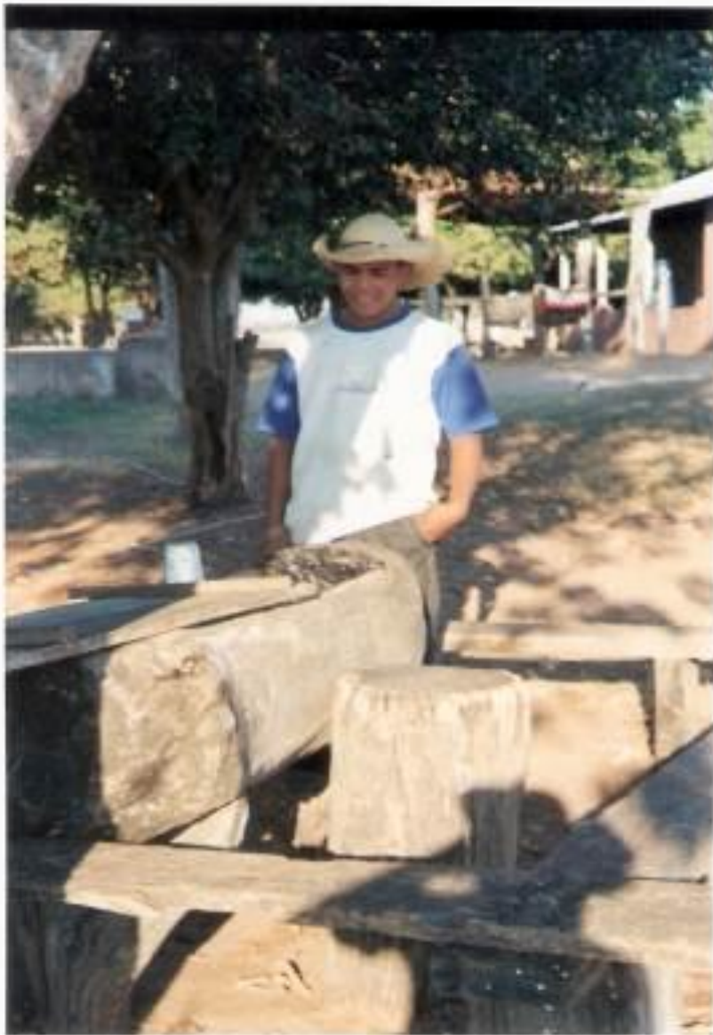
Figura 8 - “Refrigerador de madeira”, em torno do qual há bancos para consumidores da roda de tereré – Foto Eudes Leite. Pantanal sul-matogrossense, 2008 (Fonte: Projeto PRODETAB).

Igualmente, é possível trazer uma situação em que o saber tradicional cumpre uma tarefa importante. Referimo-nos, aqui, ao caso de um “refrigerador feito de madeira” que encontramos em uma grande propriedade pantaneira dedicada à criação extensiva de bovinos. Esse invento, instalado embaixo de uma frondosa árvore, nas proximidades da sede da fazenda, consiste num tronco de árvore escavado, com aproximadamente 2,5 metros de extensão, dotado de larga espessura, sobre o qual se encontra uma tábua. Com seu cerne extraído, ele se transforma num coxo, recipiente comum nos campos, utilizado para oferecer sal e ração aos animais. No caso, porém, a que nos referimos, ele é empregado como depositário de água. Como ele foi fixado embaixo de uma grande árvore, ficou praticamente imune ao calor do sol, o que favoreceu sua condição de recipiente de água. Mas a preservação da água é apenas a função inicial, há outras, como ocorre no processo que se segue: o local do repositório permite que o líquido ali reservado sofra uma espécie de resfriamento, e a água se torna “gelada”. Nessa condição, estará pronta para ser consumida na roda de tereré.